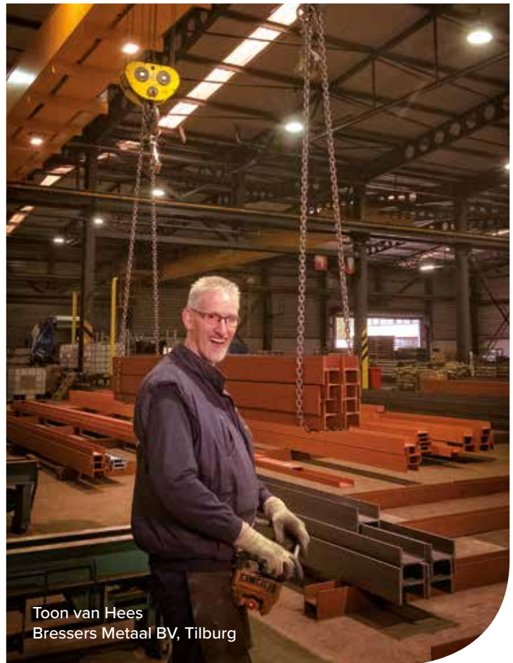
Toon van Hees Bressers Metaal BV, Tilburg

WTG onderhandelt namens haar leden met de werknemersorganisaties in de Technische Groothandel over nieuwe CAO's, te weten de arbeidsvoorwaarden-CAO en de CAO voor het FKB (Fonds Kollektieve Belangen). Met deze CAO's, die altijd algemeen verbindend worden verklaard, zorgt WTG in de gehele Technische Groothandel voor een uniform sociaal beleid en gelijke concurrentievoorwaarden. Als lid van WTG hebt u directe invloed op de CAO-onderhandelingen. Dit doordat u via de ledenbijeenkomsten, telefoon en e-mail uw mening en wensen kunt uiten. Deze kunt u zo delen met het bestuur en de leden. Bovendien bepaalt de Algemene ledenvergadering van WTG of een door het WTG-bestuur afgesloten CAO-akkoord wordt goedgekeurd of niet. Niet leden missen deze inspraak, terwijl zij zich toch aan de overeengekomen CAO's moeten houden.